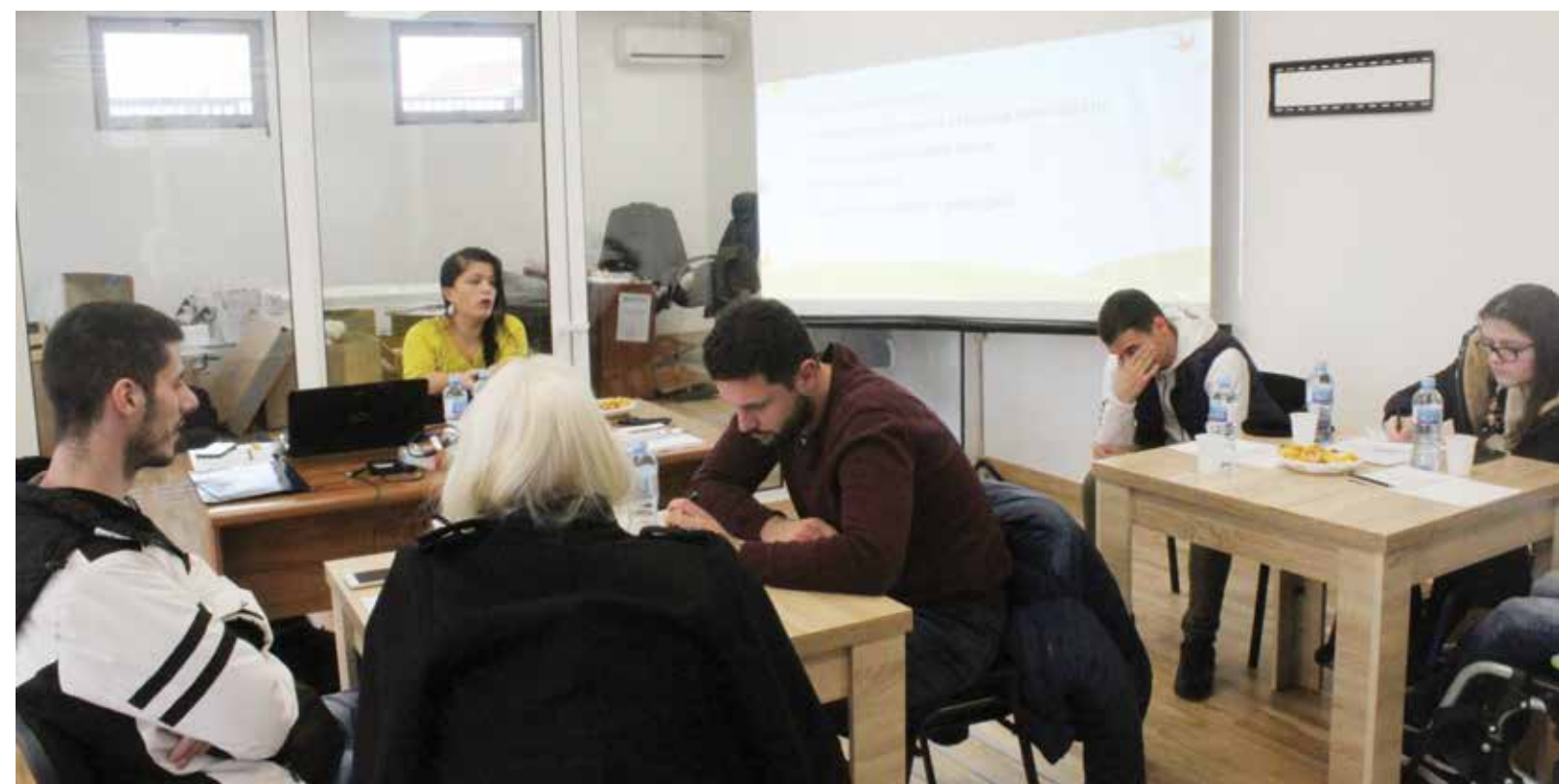
Detalji sa radionice Škola samostalnog života za lica sa invaliditetom - Samostalnost je izbor!

neodređenovrijeme van mjesta prebivališta, u skladu sa aktom Ministarstva.