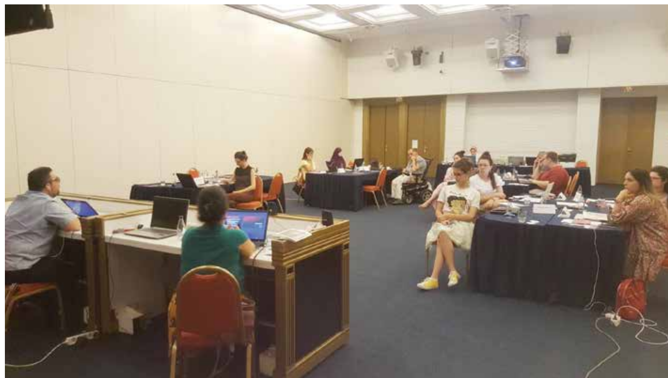
Trening za trenere o Konvenciji UN

Zaštitnik ljudskih prava i sloboda, Svetlane Kane Radević 3, Podgorica, 020/ 225-395, ombudsman@t-com.me Ministarstvo za ljudska i manjinska prava, Bulevar Svetog Petra Cetinjskog 130, Podgorica, 020/234-193, kabinet@mmp.gov.me Uprava policije 122 SOS linija za žrtve nasilja 080-111-111 Ustavni sud, Njegoševa 2, Podgorica, 020/665-410, ustavni.sud@ustavisud.me Uprava za inspekcijske poslove, Oktobarske revolucije 130, Podgorica, 020/234-421, upravazainspekcijskeposlove@uip.gov.me UNICEF Crna Gora, Stanka Dragojevića bb, UN eko-zgrada, 81 000 Podgorica, telefon: 020/447-400, 020/447-471, e-mail: podgorica@unicef.org UNDP Crna Gora, Stanka Dragojevića bb, UN eko-zgrada, 81 000 Podgorica, telefon: 020/447-400, fax: 020/447-414, e-mail: registry.me@undp.org Evropski sud za ljudska prava u Strazburu (Court of Human Rights; Council of Europe; F-67075 Strasbourg Cedex; FRANCE)