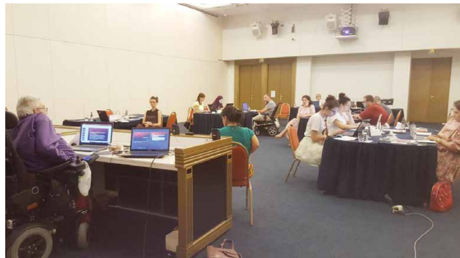
Trening za trenere o Konvenciji UN