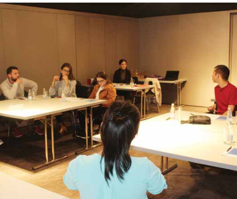
Detalji sa radionice Škola samostalnog života za lica sa invaliditetom - Samostalnost je izbor!